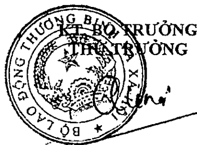
Lê Tấn Dũng